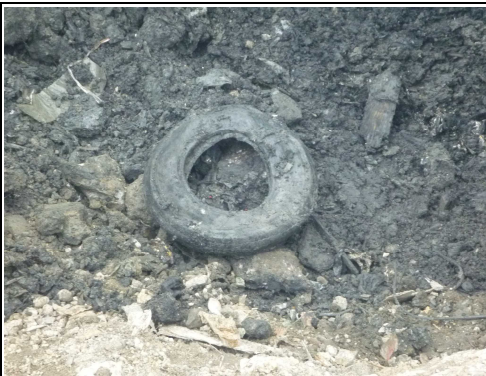
廃プラスチック類（合成ゴム）