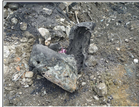
金属くず（ドラム缶）