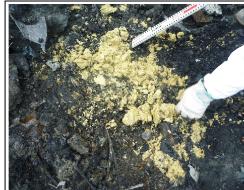
廃プラスチック類