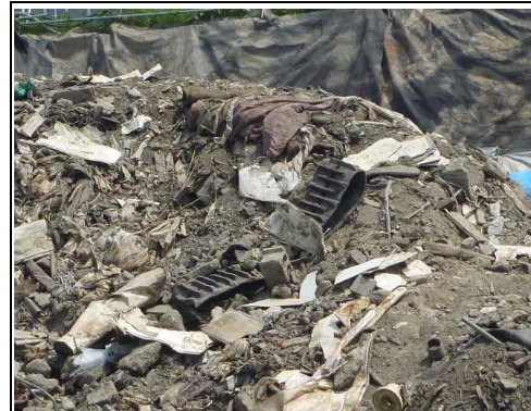
廃プラスチック類（合成ゴム）

その他に穴の開いたドラム缶が1個出てきましたが、内部に液状の廃棄物は確認されませんでした。