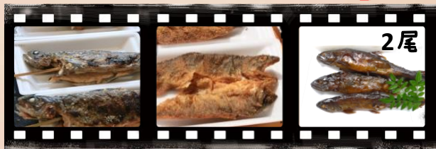
イワナ塩焼 イワナ醒井養鱒場 ビワマス甘露煮