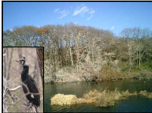
カワウのねぐらと枯れた木々（写真中央部）

しかし、この20年間に於ける生息環境の改善等により、個体数が大幅に回復、生息箇所も増加し、内水面漁業被害や森林枯死を引き起こしている。