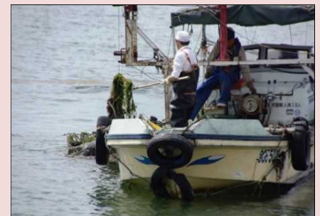
船での湖底耕耘、水草刈取