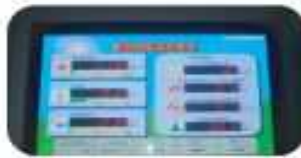
石油代替量、森林面積換算量等 表示板