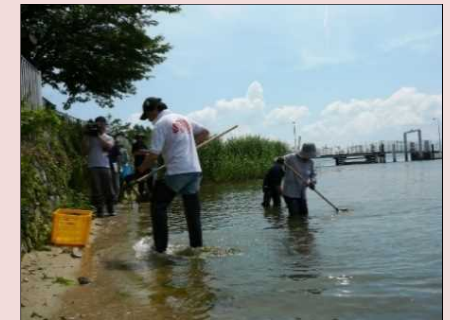
住民による湖底耕耘、水草除去

湖辺域において、水草除去や湖底耕耘を実施した場所としなかった場所を比較し、底生生物の生息状況を比較・検証