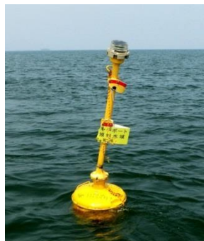
6月24日 ポール折れ 標識割れ