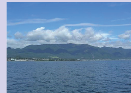
写真T-1 比良山系と琵琶湖

種々の水質改善努力により富栄養化は抑制されましたが、琵琶湖の水環境は必ずしも健全な状態にあるとはいえず、異臭味の発生による利水障害、水草の大量繁茂による環境悪化、在来魚介類の減少をはじめとした生態系の脆弱化が顕著になっています。健全な琵琶湖の水環境を保全・管理・再生していくためには、流域全体を視野に入れ、今後も水質汚濁負荷削減を継続しながらも、水循環、水生生物、水辺地を含む水環境を総合的に評価と改善手法を見出すことが必要です。COD等の環境基準の順守だけでなく、湖沼の特性を踏まえた長期的な視点に立った水環境の目標の提示も求められています。以上のことから、良好な水質と多様で豊かな生態系が両立する琵琶湖の実現に向けて、水質と生態系のつながりに着目したTOC等による新たな水質管理手法を検討しているところです。