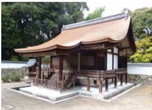
国宝 園城寺新羅善神堂保存修理（平成23年度竣工）

県では、「滋賀県文化財保護条例」に基づき、これらの文化財調査・指定（選択）・保存修理・公開・教育普及などに取り組んでいます。