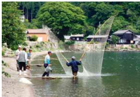
重要文化的景観 高島市海津・西浜・知内の水辺景観

また、県では「琵琶湖と水が織りなす文化的景観所在確認調査報告書」（平成23年3月）を作成し、こうした文化的景観を文化財として保護し、活用する取り組みを進めています。