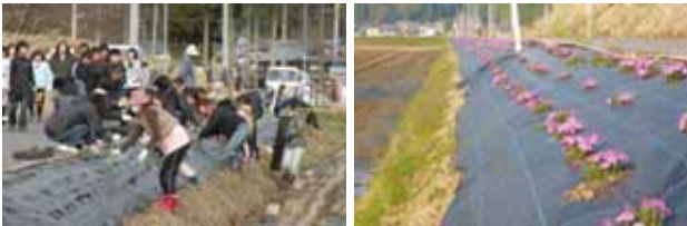
芝桜の植栽（長浜市杉野）

をつなぐ農村まるごと保全向上対策」による共同活動の中で「心なごむ田園景観を守り育てる取り組み」として農道法面への植栽や、営農活動と一体となったきめ細やかな草刈りなど、地域ぐるみの取り組みにより空間的広がりを持った田園地帯の景観形成に努めています。