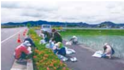
道路愛護活動事業（野洲市）

また、道路植栽の維持管理についても、地域住民や企業とともに取り組み、道路への愛着心を醸しながら、沿道景観づくりを推進しています。