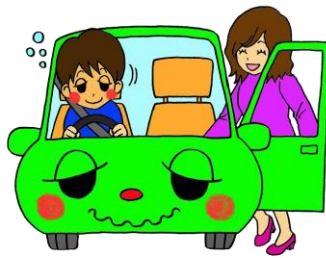
飲酒運転車両 への同乗