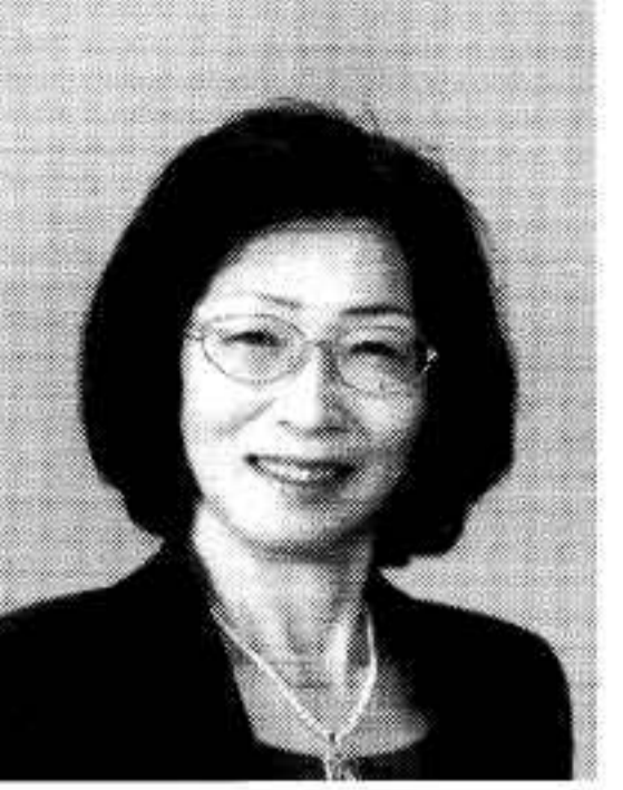
最高裁判所判事 鬼丸かおる 昭和二四年二月七日生