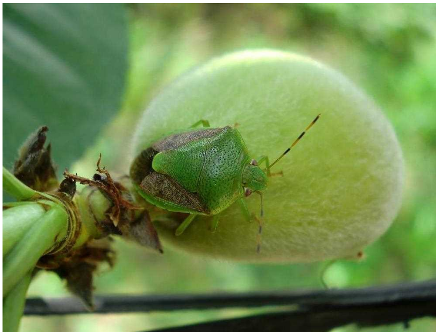
図1 チャバネアオカメムシ