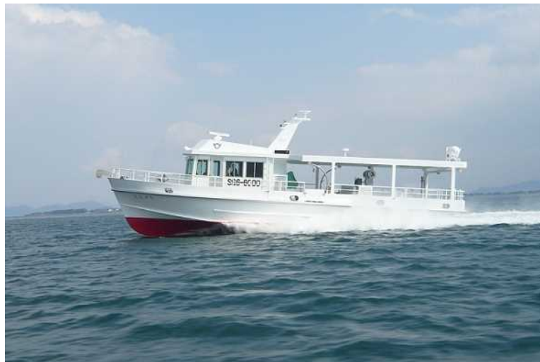
写真 漁業調査船第 10 代琵琶湖丸