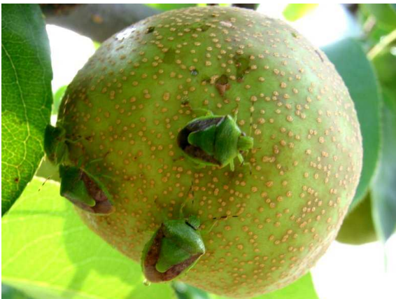
図3 ナシ果実上のチャバネアオカメムシ

お問い合わせ先： 滋賀県農業技術振興センター花・果樹研究部 TEL:077-558-0221 Email:GC58@pref.shiga.lg.jp