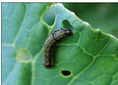
図3 キャベツを食害するハスモンヨトウ老齢幼虫

お問い合わせ先：滋賀県病害虫防除所 TEL:0748-46-4926 FAX:0748-46-5559 Email:GC70@pref.shiga.lg.jp http://www.pref.shiga.jp/g/byogaichu/