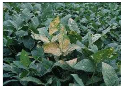
図2 ダイズ白変葉（若齢幼虫による食害）