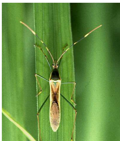
クモヘリカメムシ