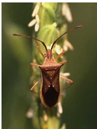
ホソハリカメムシ