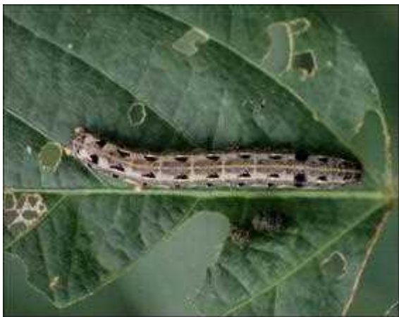
図4 ハスモンヨトウ老齢幼虫