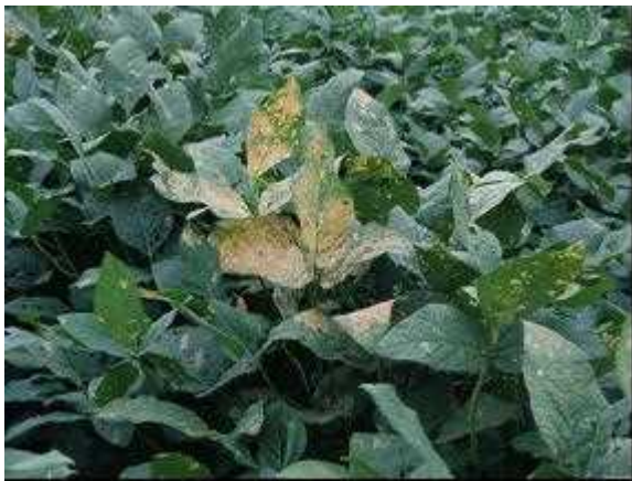
図2 ダイズ白変葉（若齢幼虫による食害）

※調査基準日は8月25日（H28年は8月22日～25日に調査）。H28年は26地点（大津南部地域7地点、甲賀地域2地点、東近江地域8地点、湖東地域4地点、湖北地域4地点、高島地域1地点）で各地点2ほ場（計52ほ場）を調査。