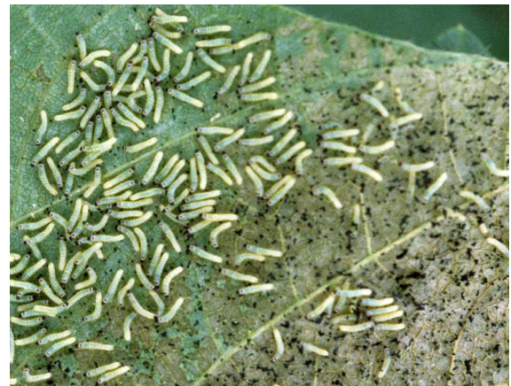
図3 葉裏に群がるハスモンヨトウ若齢幼虫