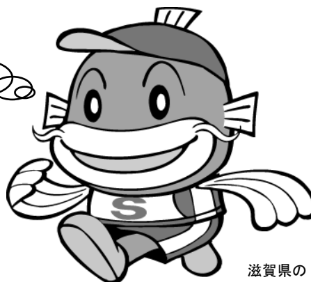
滋賀県の イメージキャラクター キャッフィー