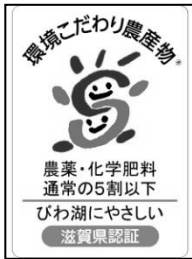
環境こだわり農産物の認証マーク

農薬と化学肥料を通常の5割以下に減らすとともに、びわ湖や周辺環境に配慮して栽培された農産物を県が認証し、左の「環境こだわり農産物の認証マーク」が付されたもの