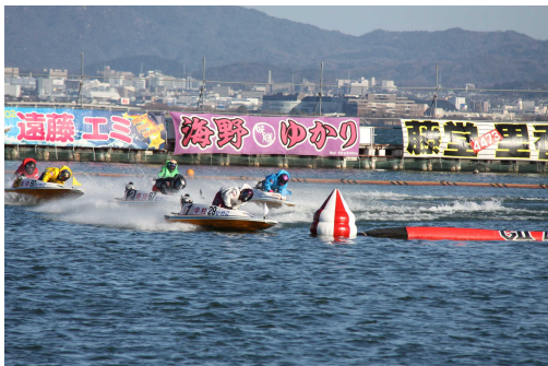
迫力のボートレース