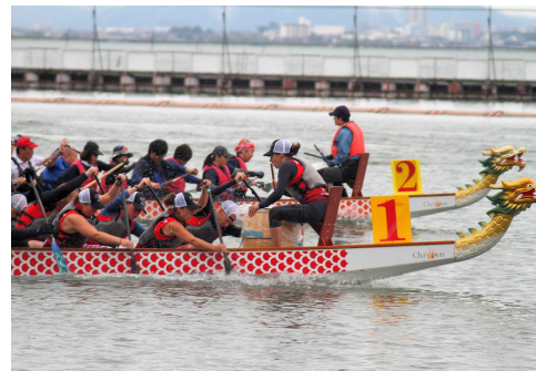
スモールドラゴンボート日本選手権大会 （平成29年10月29日（日））