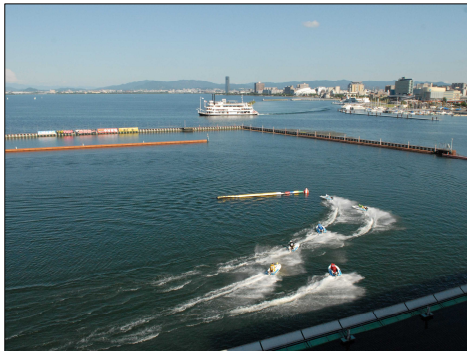
絶好のロケーションで迫力のボートレース