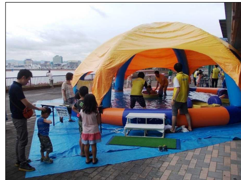
ファミリーカーニバル (平成26年8月3日(日))