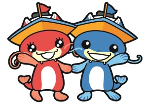
マスコットキャラクター 「ピナスちゃん」「ピナちゃん」

また、びわこボートレース場では競艇事業以外に、ファミリーカーニバルの開催など、施設の紹介や競艇事業のPRに努めています。