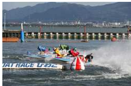
迫力のボートレース