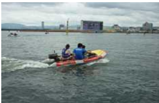
ファミリーカーニバル 平成26年8月3日(日)