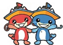
マスコットキャラクター 「ピーナスちゃん」「ピナちゃん」

また、びわこボートレース場では競艇事業以外に、ファミリーカーニバルの開催や、びわ湖ドラゴンボートスプリント選手権大会の会場として施設を開放するなど、施設の紹介や競艇事業のPRに努めています。