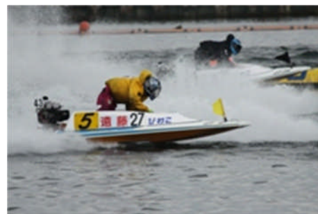
迫力のボートレース