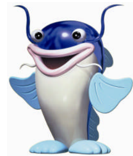
マスコットキャラクター 「ピナちゃん」

また、びわこボートレース場では競艇事業以外に、ファミリーカーニバルの開催や、びわ湖ドラゴンボートスプリント選手権大会の会場として施設を開放するなど、施設の紹介や競艇事業のPRに努めています。