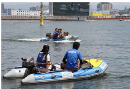
ファミリーカーニバル 平成25年8月4日（日）