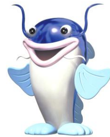
マスコットキャラクター 「ピナちゃん」

また、びわこボートレース場では競艇事業以外に、ファミリーカーニバルの開催や、刑務所矯正展の会場として施設を提供するなど、施設の紹介や競艇事業のPRに努めています。