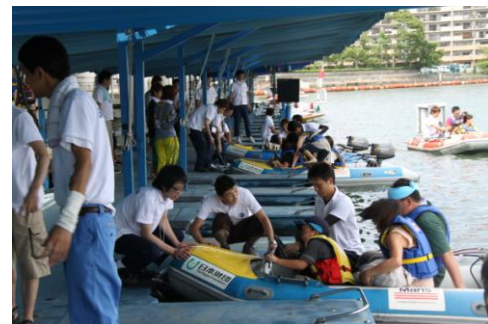
ファミリーカーニバル 平成24年8月12日（日）