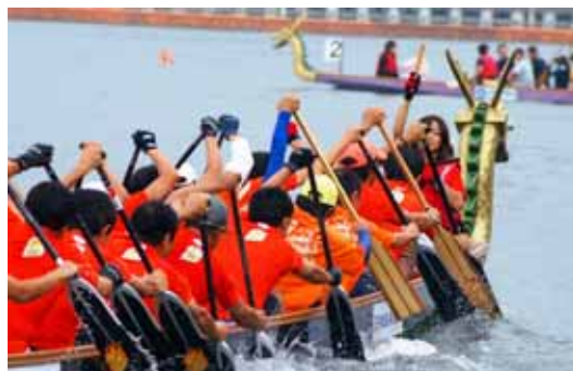
びわ湖ドラゴンボートスプリント選手権大会 平成21年9月12日(土)