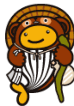
信楽焼たぬきクーちゃん (滋賀県のご当地クーちゃん)

なぜ県内で買って欲しいのかって？それは、滋賀県内で売れた宝くじの収益金は、滋賀県の収入になるからだよ。そうしたお金が道路や橋、学校、公園の整備など県内の公共事業に使われているからさ。みんなの豊かな生活のためにたいへん役立っているのです。