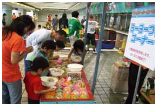
ファミリーカーニバル 平成21年8月9日(日)