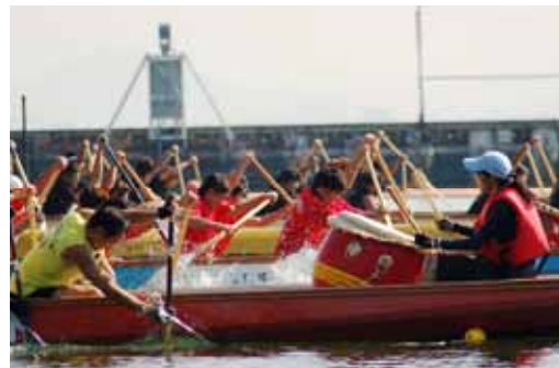
びわ湖ドラゴンボートスプリント選手権大会 平成20年10月18日(土)