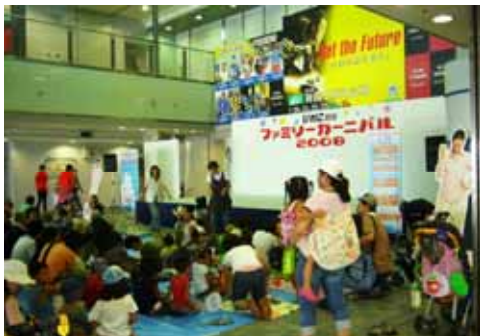
ファミリーカーニバル 平成20年8月17日(日)