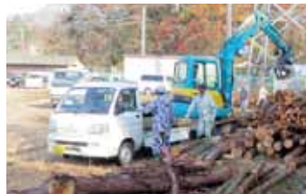
↑間伐材買取りの様子 材を積んだ軽トラが続々集まる

生まれた「繋がり」は、地域材の供給体制や、企業の環境貢献活動、地域材商品の開発・販売など幅広く、これらの取組が評価され、27年度には東近江市「わがまち協働大賞」や総務省「ふるさとづくり大賞」を受賞されました。