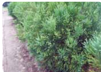
油日林木育種場にて。「花粉の少ないスギ」に薬剤処理を行い、種子をつけさせている。