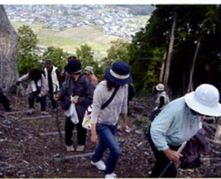
頂上に向かってみんなで登山

正法寺山（362m）は鎌掛地区のシンボルであり、地区を見守る里山です。この正法寺山が長年、山の手入れがされなくなって雑木が茂り、枯れ松の倒木などで荒れていました。平成20年度に滋賀県の「琵琶湖森林づくり県民税」による里山リニューアル事業を実施しましたところ、里山がよみがえり子どもでも登れる里山になりました。頂上からの見晴らしはすばらしく、鎌掛地区の全景から日野町の中心部、遠くは八幡山から比良山まで望めるようになりました。地元では引き続き整備をし、今年度は「正法寺山散策案内看板」（30m×30m）を2基設置するとともに、登山道の整備や案内標識を設置して誰でも登ってみようと思えるようにしました。さらに、頂上に新しく観音堂を設置し、観音様が頂上から鎌掛を見守っていただけのようにになりました。