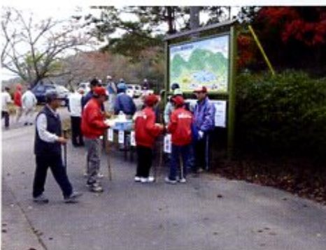
正法寺山散策案内図看板前にて「どの道を通ろうかなあ？」

また境内には、国の重要文化財に指定されている「石造宝塔」があり、その他大日堂、天満宮社、金毘羅社、稲荷社が建ち並んでいます。正法寺山の中腹には岩を削って祠を作り石造を祀った行者堂もあります。