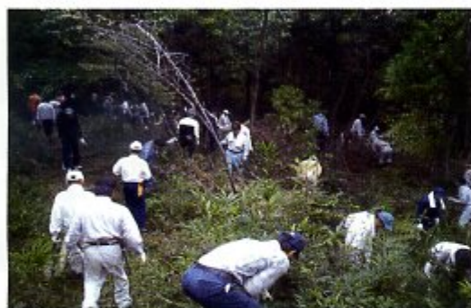
住民自ら森林整備作業