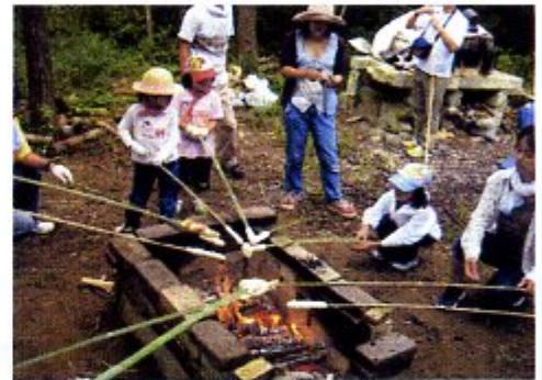
森林の中でパン作り