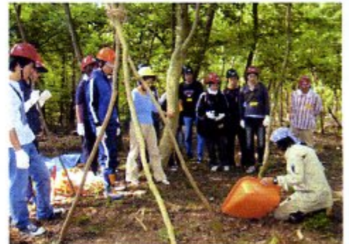
みんなで落ち葉かき

この事業は、より多くの方が（みんなが）森林づくりに参加していただくための活動をしている団体を支援する事業です。琵琶湖森林づくり基本計画を進めるために4つの基本施策に当てはまる活動をする各種団体を支援します。森林との関わりは人それぞれです。直接森林の手入れをしていただく団体、森林の良さを多くの方に伝えていただく団体、森林から生まれた木材の利用を進めていただく団体など、様々な形での活動が対象となります。