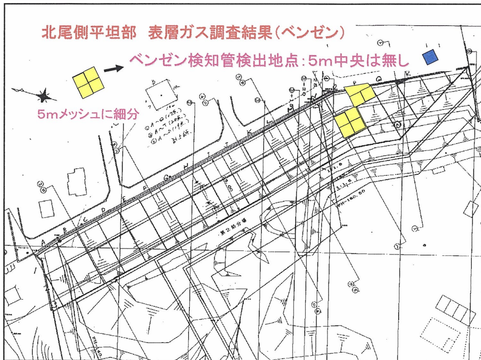
図2.6-12 北尾側平坦部 表層ガス調査結果(ベンゼン)