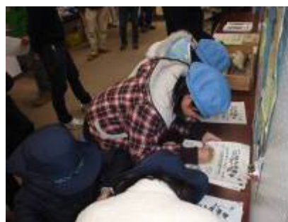
展示ブースへの感想(ラブレター)の記入