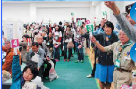
昨年の様子(2011年アンケート)