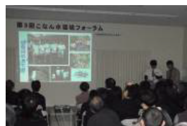
活動発表の様子（伯母Q五郎）

「伯母Q五郎の日常の活動報告」 草津市内を流れる伯母川を中心に水質調査などを定期的に行っており、また、単独での活動以外にも県内外のこどもエコクラブ、NPO、NGO法人などと共同で行っている活動内容について発表していただきました。