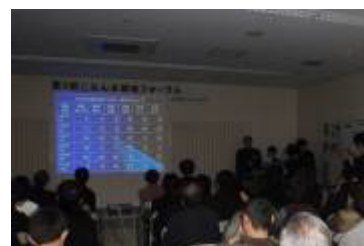
活動発表の様子（守山南中学校科学部）

「市内6地点河川水質調査の結果」 平成11年度から行ってきた校区内6カ所の河川水質調査を行っており、今回は平成23年3月～10月にかけての結果を発表してもらいました。リン酸や硝酸の値が月によって変動する理由などについて考察していただきました。