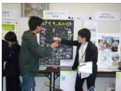
展示ブースへのインタビューの様子