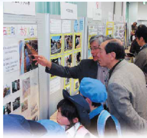
昨年の様子(展示ブース)