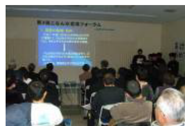
活動発表の様子（栗東中学校科学部）

「池に生息するプランクトンはなぜ池によって異なるのか」 2003年から中学校周辺にある、大きさ、水の利用方法、水源等の異なる4つの池のプランクトンを比べ、池に生息するプランクトンはなぜ池によって異なるかを発表していただきました。