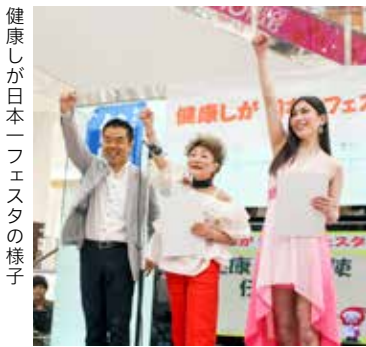
健康しが日本一フェスタの様子 県広報誌「滋賀プラスワン」は、点字版・音声版でも配布しています。音声版の「みんなでプラスワン!」のコーナーは三日月知事の朗読によりお聞きいただけます。

夜間であれば? 支援が必要な人は? 家族の連絡は? スマホの充電は? : 等、「いざ」という時の行動について考え、話し合っておきましょう。大切な「いのち」を守る滋賀県、災害に負けない滋賀県を、一緒につくっていきましょう!