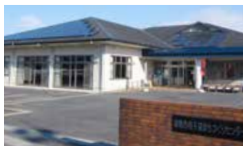
太陽光パネルを設置した柑子袋まちづくりセンター(四号機)

地域の自然エネルギーを資源として活用し、地域社会の持続的な発展に寄与することを目的に取組が始まりました。市民の出資で発電所を設置し、得られた収益を「地域商品券」で配当、寄付参加者にも地域特産品で還元を行うことで、地域経済の活性化を目指しています。