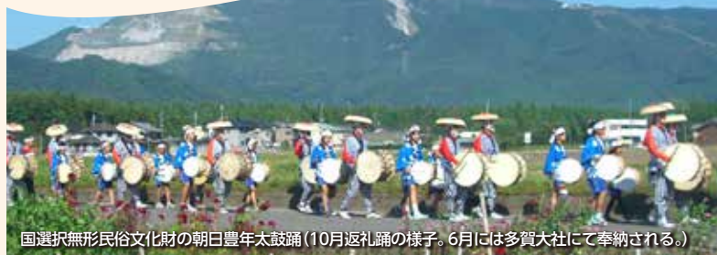
国選択無形民俗文化財の朝日豊年太鼓踊(10月返礼踊の様子。6月には多賀大社にて奉納される。)