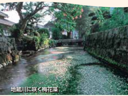
地藏川に咲く梅花藻