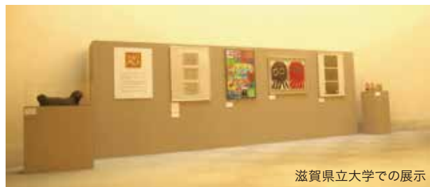
滋賀県立大学での展示

アール・ブリュットの魅力をより多くの人たちに伝えるために、 複数の県立施設でアール・ブリュットを常設展示する全国初 の試み、『ふらっと美の間』を展開しています。 滋賀県の作家および国内外の展覧会に出品された作家の作 品を中心に展示し、アール・ブリュットの魅力を伝えています。