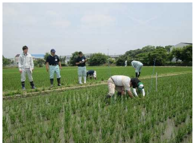
実証ほの調査の様子