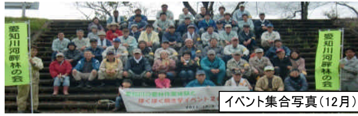
イベント集合写真(12月)