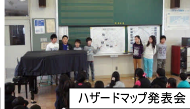
ハザードマップ発表会