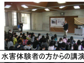
水害体験者の方からの講演