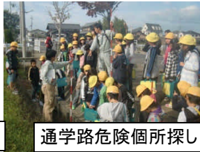
通学路危険箇所探し