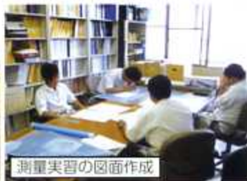
測量実習の図面作成