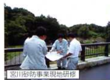
宮川砂防事業現地研修

また、河川の測量実習で、現地測量から図面作成、数量計算書、積算まで一連の業務を体験してもらいました。