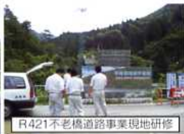
R421不老橋道路事業現地研修