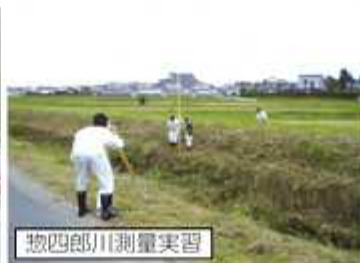
惣四郎川測量実習