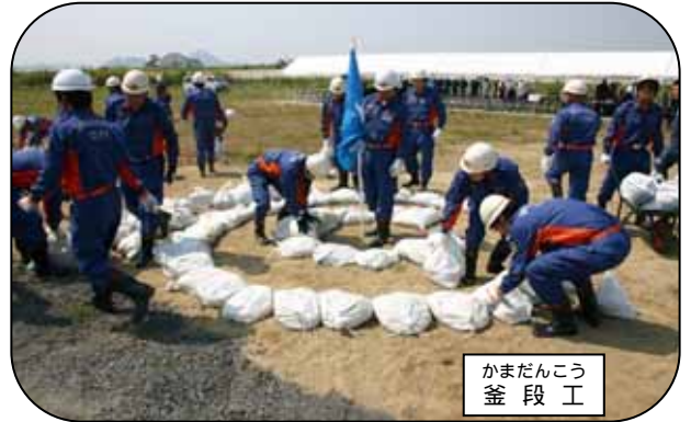
かまだんこう 釜段工

今回の訓練は水防関係者の意識・水防技術の向上を図るとともに、住民の方々の水防に対する理解と協力を深めることを目的として開催しました。訓練を通して参加者それぞれが、改めて水防の大切さを認識することができました。訓練で得られた知識と技術を、今後の水防活動に活かしていきたいと思えます。