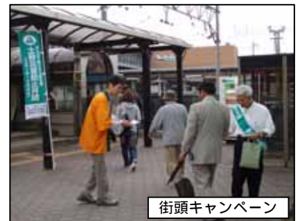
街頭キャンペーン

情報伝達訓練 大雨の際、土砂災害の発生するおそれが高まった市・町に対し、気象庁と県が発表する「土砂災害警戒情報」が、住民の皆さんに的確に伝わり、避難してもらえよう、6月4日(水)に彦根地方气象台、県庁砂防課、振興局建設管理部、市町、自治会(日野町鎌掛区)の職員が情報伝達訓練を行いました。訓練は電話やFAXを使い、避難の参考となる情報の伝達や、災害状況を報告する方法などを確認しました。