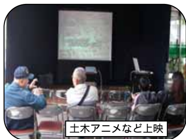
土木アニメなど上映

土木の日に近い「2007東近江秋まつり」の二五八祭 にこはちまつり と同時開催し、さわやかな秋晴れに恵まれて大勢の人々にお越しいただき、とても賑わいました。