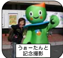
うおーたんと 記念撮影