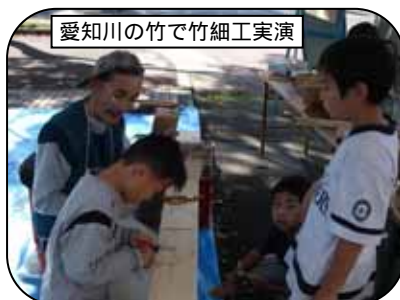
愛知川の竹で竹細工実演