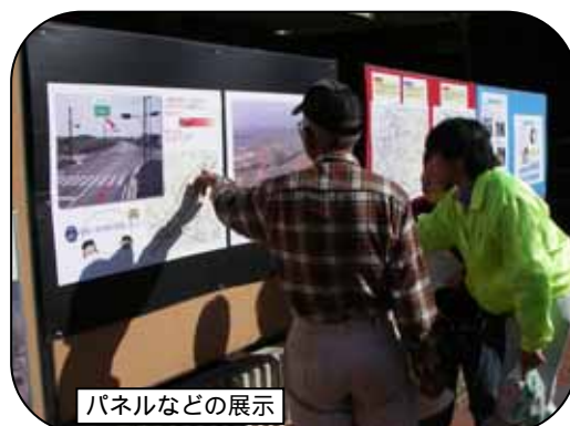
パネルなどの展示