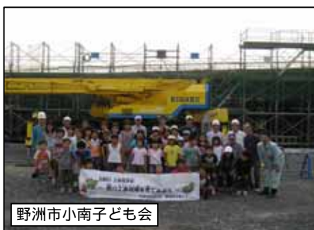
野州市小南子ども会