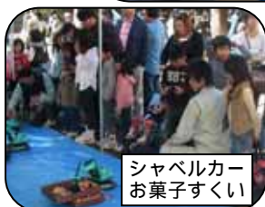
シャベルカー お菓子づくり