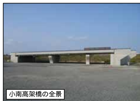
小南高架橋の全景

11月で小南高架橋は舗装を残しほぼ完成しましたが、これから取付け部分の工事を行います。 新しい仁保橋が完成すれば、仁保橋・小南高架橋を同時に開通する予定をしています。