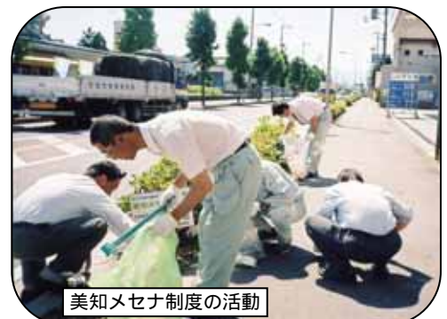
美知メセナ制度の活動