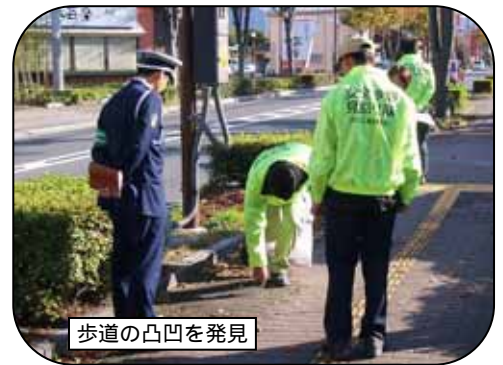
歩道の凸凹を発見

今後、効果や課題などを検証し、「安全歩道見回り隊」の発足地区を増やしたいと考えています。