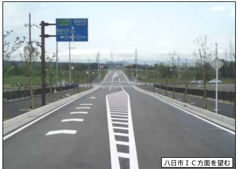
八日市IC方面を望む