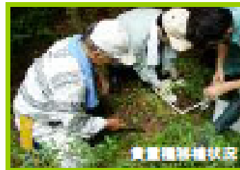
貴重植物移植状況

東近江市紅葉尾町神崎橋から同市黄和田町八風谷橋までの延長約2.9kmが施工区間となっており、冬季通行止め等の規制を解消することが望まれています。 現在、用地取得を進めながら、工事に伴う改変区域内で貴重植物の移植など環境への配慮をしながら工事を開始したところです。