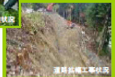
道路拡張工事状況

なお、この事業は追賀国道事務所施工の直轄事業「石神峠道路事業」に隣接した一連の事業です。