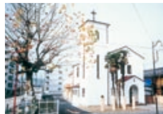
ヴォーリスゆかりの教会

清掃作業、ビヤ樽プランター設置、道しるべ設置、ポケットパーク造成、低木の植栽、ベンチの設置、プランター増設、平成11年度第14回景観づくり草の根のつどい開催等