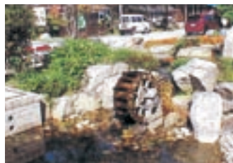
益田公民館前公園