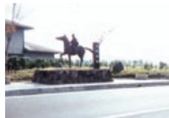
足伏走馬ポケットパーク

町花（コスモス、ローマンカモミール）、町木（ソメイヨシノ）決定、フラワーポット・ローマンカモミール各戸配布、花植栽、遊歩道整備、看板設置等