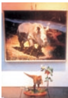
アートなどの展示