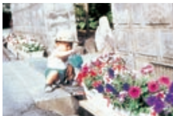
フラワーポット設置