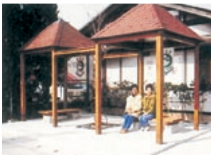
ポケットパーク整備