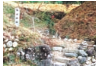
鮎河城跡シンボルパーク整備

緑化運動、花づくり運動、桜並木保存活動、鮎河城跡シンボルパーク整備、桜まつり開催、先進地視察等