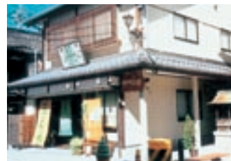
米川沿いにあるお茶屋

ストリートミュージアムの展開、広報誌の発刊、開知カレッジの実施、植樹事業、道路の共同清掃、各種イベントの開催、平成10年度第13回景観づくり草の根のつどい開催等