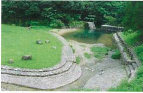
砂防環境整備事業（山口県）