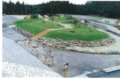
ふるさと砂防事業（青森県）