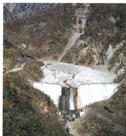
日向砂防えん堤 (日光砂防事務所)

昭和初期から、材料としてコンクリートが採用されるようになり、土石流など甚大な土砂災害に結びつくような土砂移動現象に対して、土砂災害防止効果が大きく、安全性の高い砂防施設が各地で建設されるようになった。このように、積極的に砂防堰堤、溪流保全工等を整備し、国土の保全と国民の生命・財産の保全に貢献してきた一方で、施設規模が大きく出来ることから、一定の空間を防災のために独占してしまう側面も有していた。