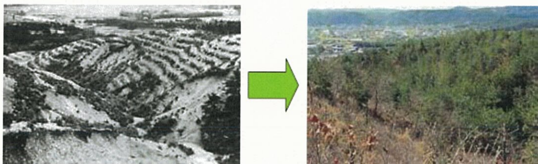
(昭和30) 庄内川水系 土岐川 団子山 (岐阜県) (平成2)

明治30年の砂防法の制定以来、特に明治、大正、昭和の戦前にかけて、荒廃山地における土砂生産を抑制するための工法として山腹工が広く施工された。これらは、自然の回復力を生かして自然環境との調和を図りつつ、緑豊かな国土の復元に大きな役割を果たしてきた。