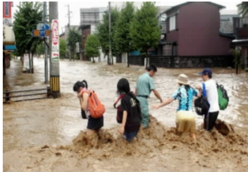
福井市西木田3丁目(福井新聞)