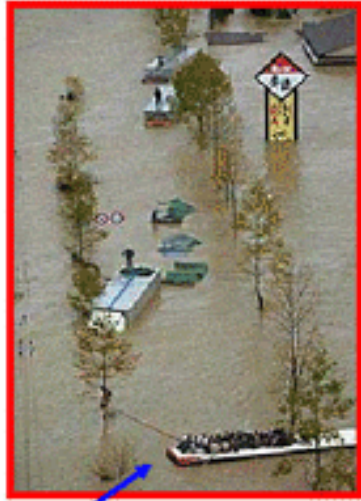
バスの屋根に避難