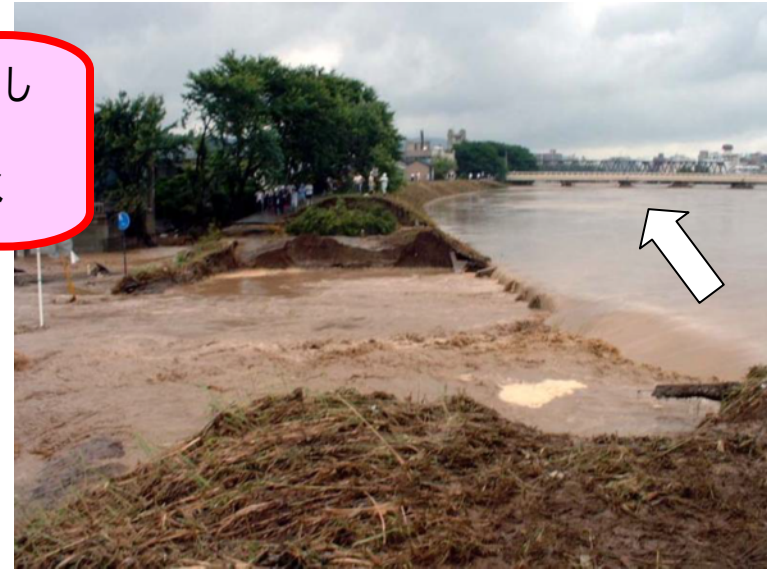
木田橋上流左岸破堤箇所(足羽川ダム)