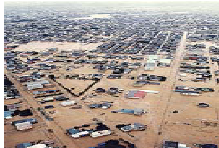
福井市内(県民福井)