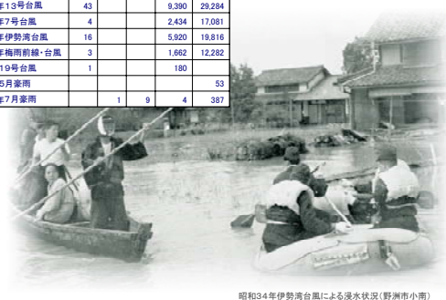
昭和34年伊勢湾台風による浸水状況(野洲市小雨)