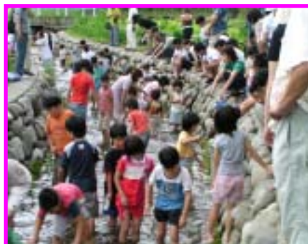
【 魚つかみ 】