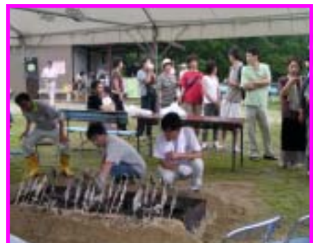
【 イワナの塩焼き 】