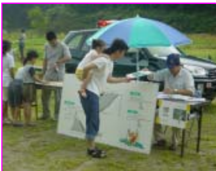
【 姉川ダムパネル展示コーナー 】