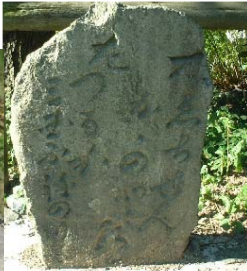
関所跡の石碑と道標

道(刀根越え)の分岐点(「右えちぜん かが のと道 左つるが 三国ふねのりば」と書かれた道標(写真)が残る)として重視され、江戸時代の初期より関所が設置されていました。関所とは、要路または国境に設けて、通行人、通過貨物を検査し、脱出や進入に備えたところで、律令時代に治安維持のため制度化されたのが始まりです。関所破りは重罪に処せられたようです。柳ヶ瀬の関は、彦根藩の支配下にあり、五十石取りの武士2人と番役8人が管理し、夜間の通行は一切許さず、女改めが特に厳しかったといわれます。江戸時代に老中より出された、関所を管理していた役人に対する掟が今も残されています。