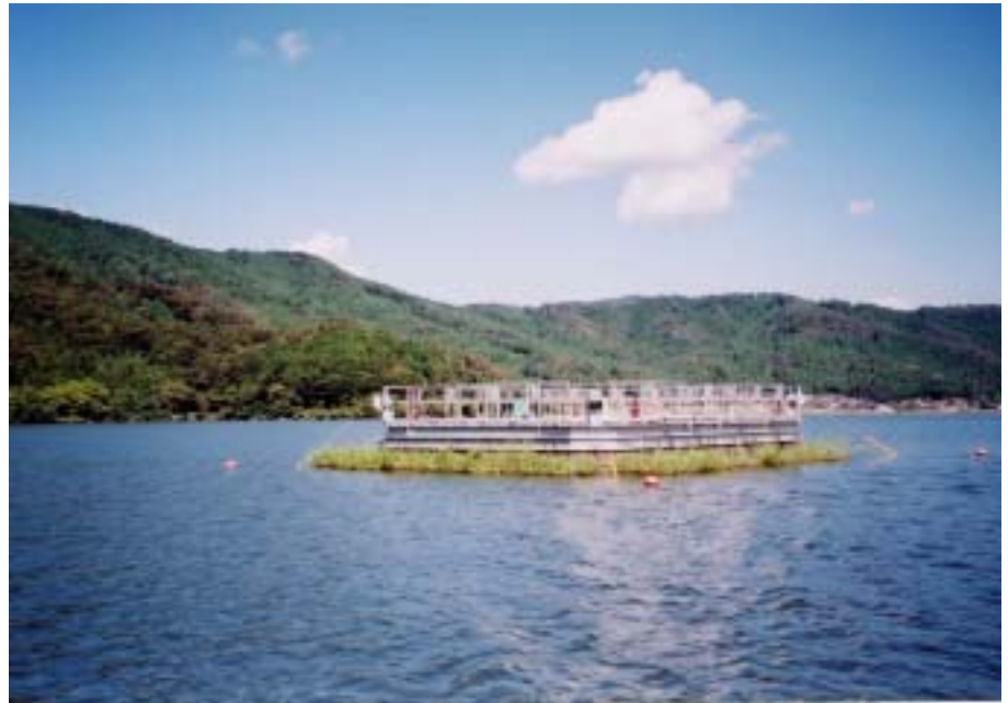
底層(深層)曝気装置

このような状況で、早急に余呉湖の水環境を改善するため主要因である湖底無酸素区域の解消を目的として、平成12年度から国土交通省の国庫補助事業採択を受け、余呉湖ダム貯水池水質保全事業を開始しました。平成14年6月には、低層部に集中的に酸素を送り込み、底泥栄養塩類の溶出を抑制することを目的として、底層(深層)曝気装置を稼働しています。