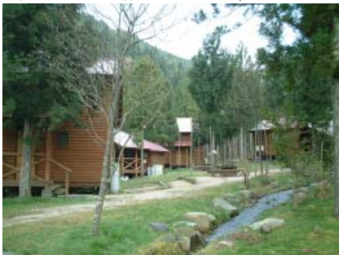
ログハウス風コテージ