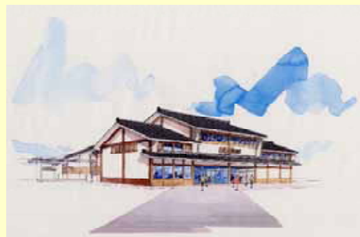
JR 木ノ本駅 完成予想図

日時：10月21日(土) 午前 8時30分 ~ 午後 2時00分 場所：JR木ノ本駅周辺