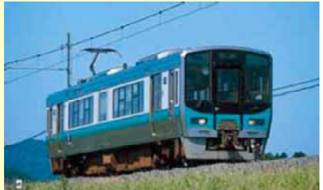
新しい普通電車(125系)

北陸線では、これまで長浜止まりだった新快速が近江塩津あるいは敦賀まで運行するようになり、運行本数が増えます。湖西線では、これまで極端に少なかった永原～近江塩津間の運行本数が増え、北陸線との接続の待ち合わせが同じホームで出来るようになるため、湖北地域と湖西地域との間の往来が便利になります。