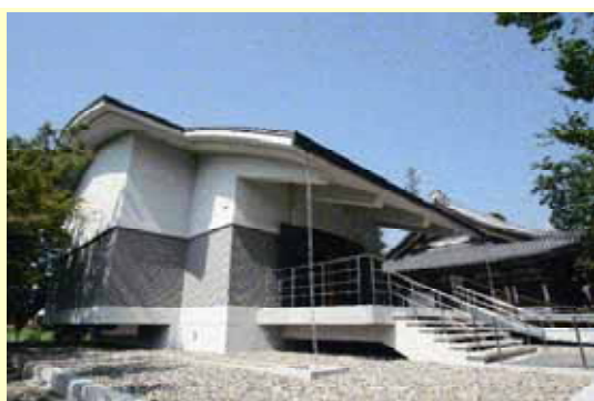
渡岸寺観音堂(向源寺)