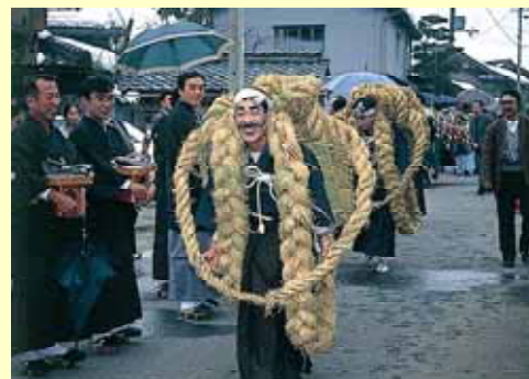
湖北の伝統文化「おこない」

日時：10月21日(土) 午前 8時30分 ~ 午後 4時00分 場所：JR高月駅東口駐車場およびその周辺