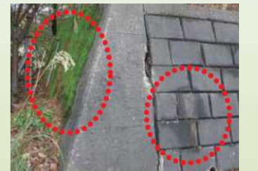
水がしみだしているかどうか確認

⇒日頃から、避難場所へのルートを確認し、災害時の避難方法などの検討に役立てていただければと期待しています。