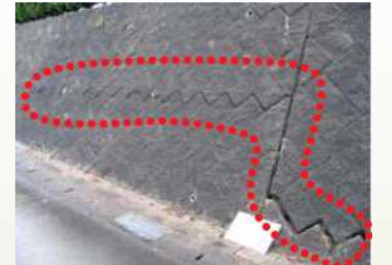
長い亀裂の有無を確認

「わが家の宅地チェックポイント」 (URLは http://www.mlit.go.jp/common/000113277.pdf )