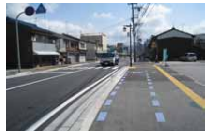
彦根近江八幡線京町 [補修担当]