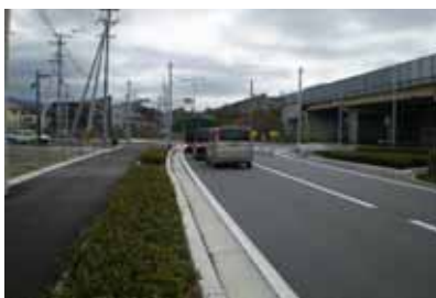
多賀町土田地先 [改良担当]