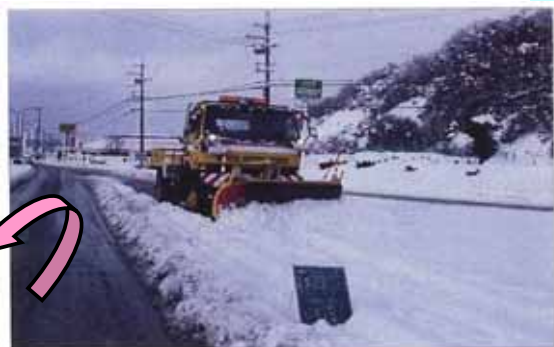
〔業者委託による除雪作業〕