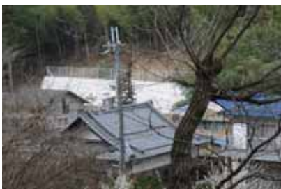
鳥居本町高根(自治会) [砂防担当]