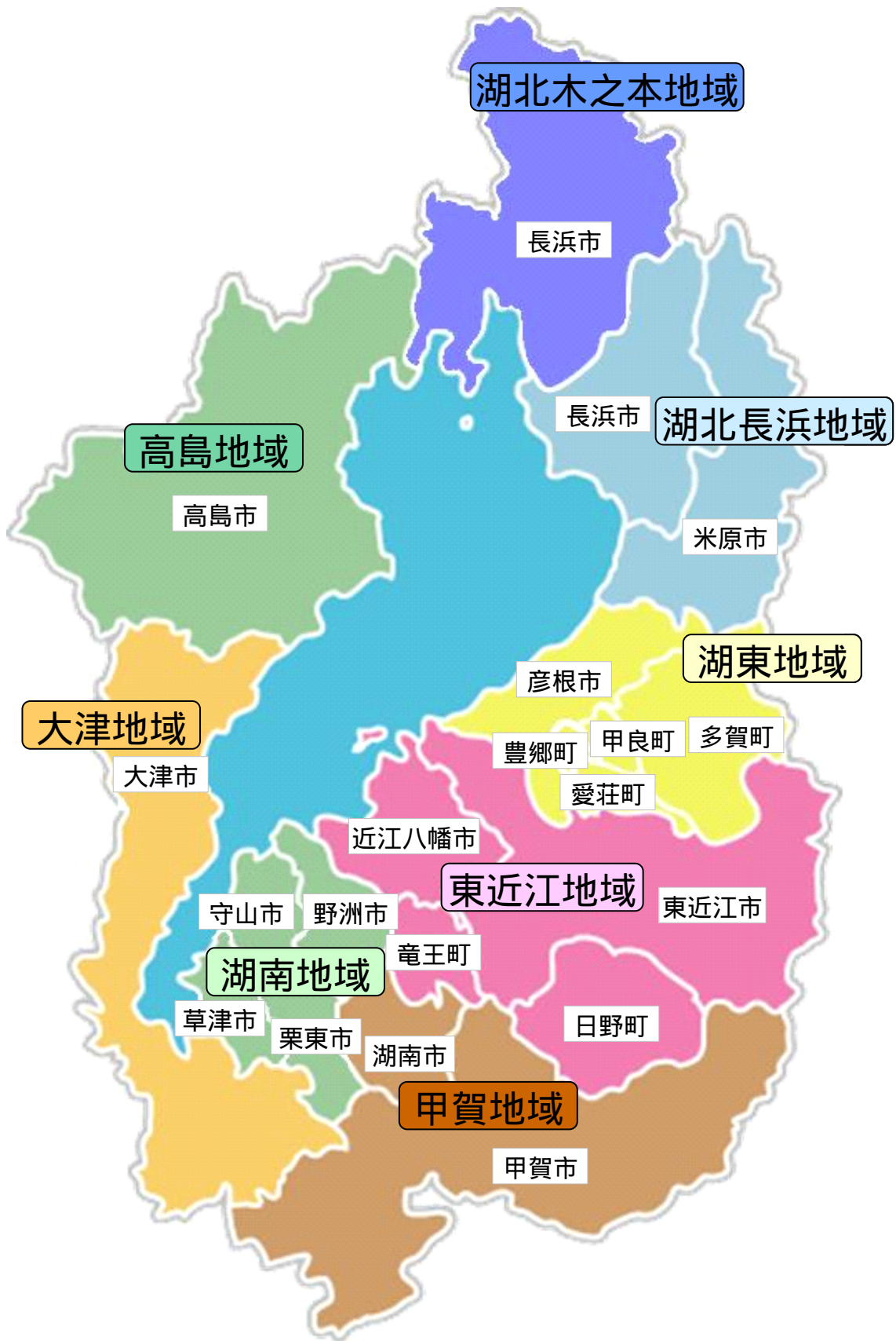
図 地域区分図(建設管理部管内図)