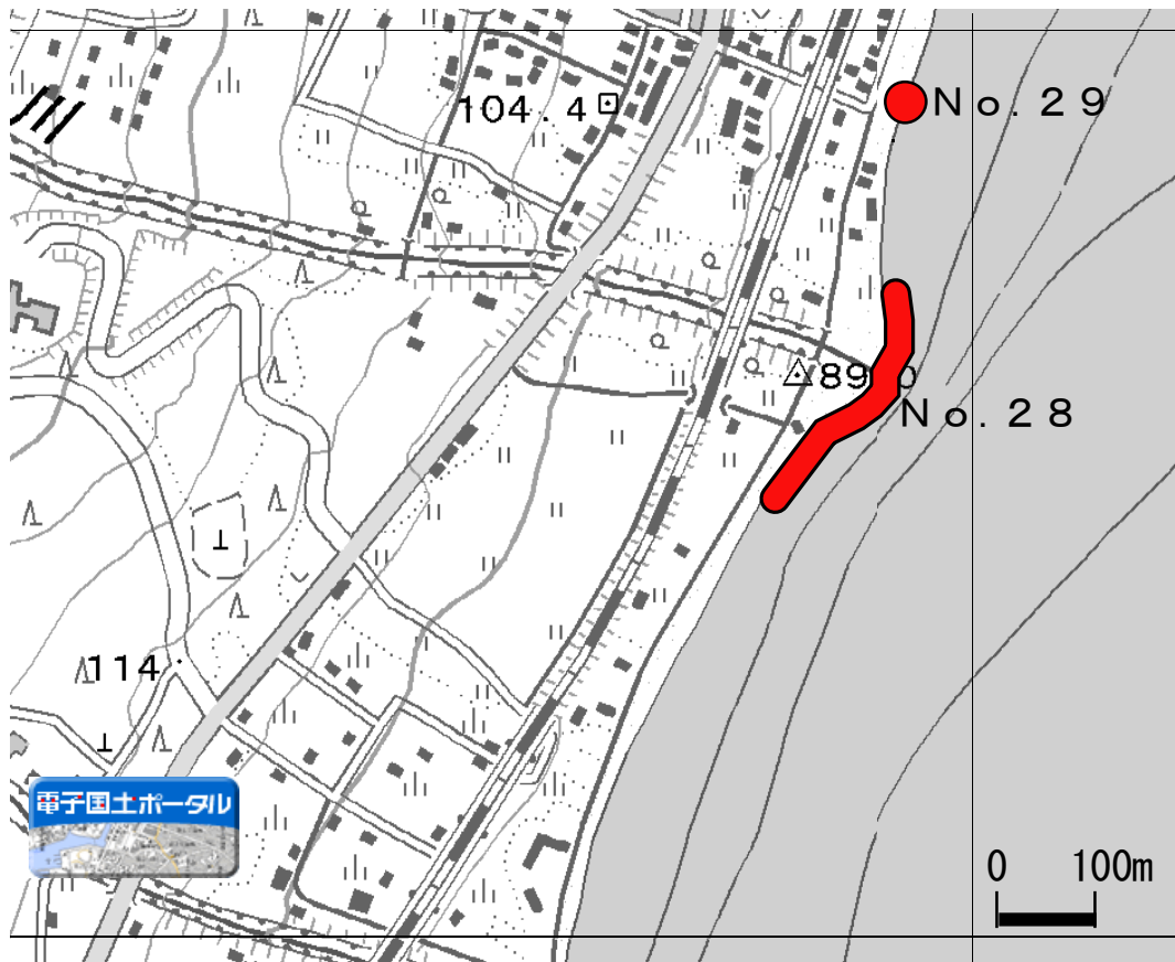
外来魚産卵床確認位置図(10)