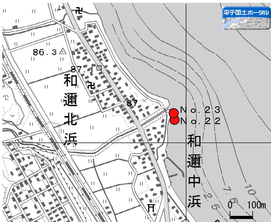
外来魚産卵床確認位置図(7)