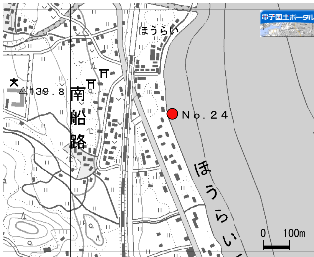
外来魚産卵床確認位置図(8)