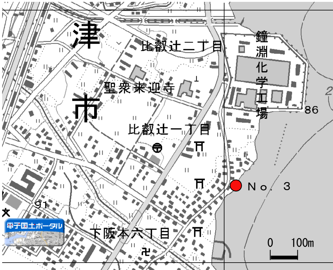
外来魚産卵床確認位置図(2)