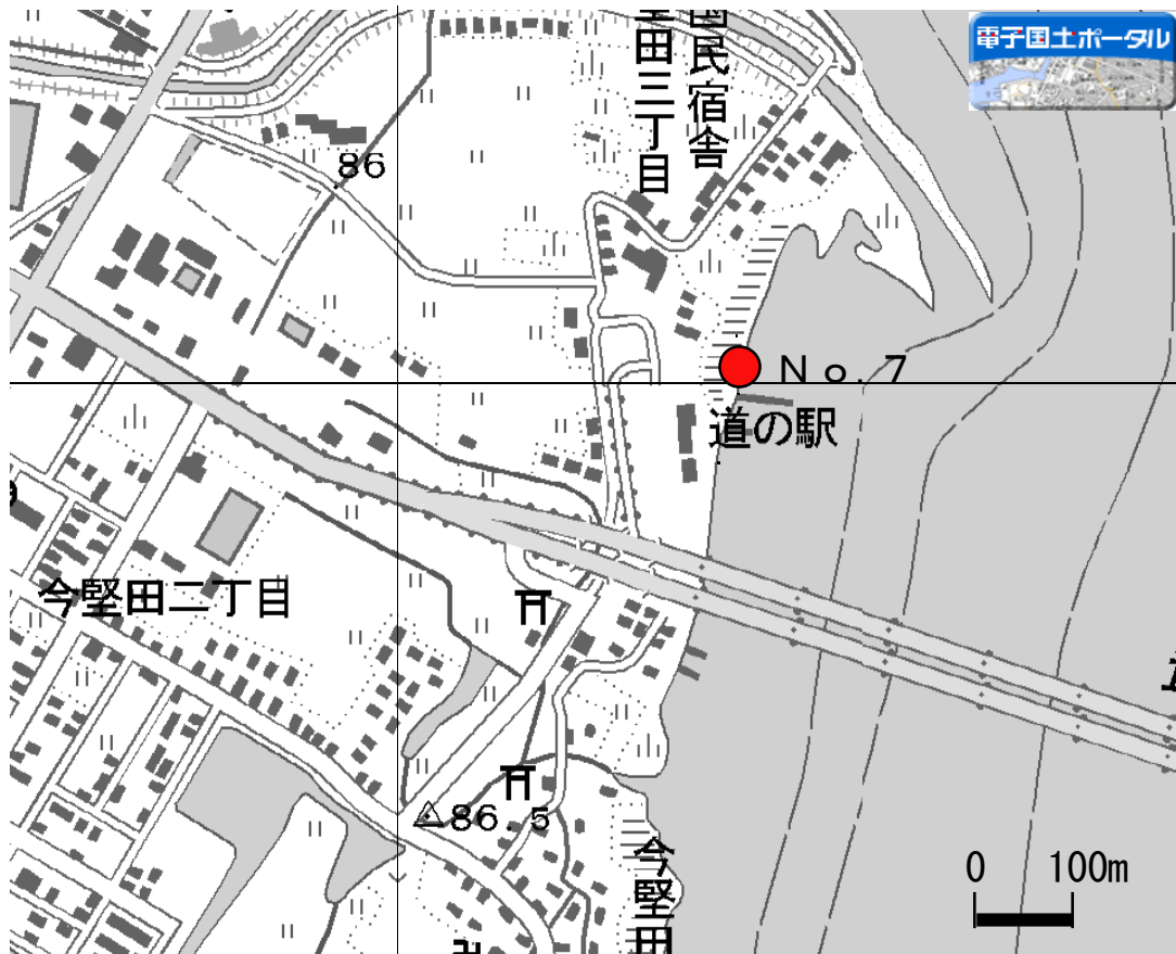
外来魚産卵床確認位置図(4)