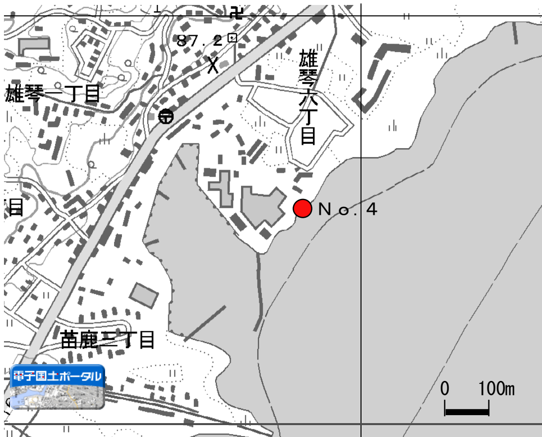
外来魚産卵床確認位置図(3)